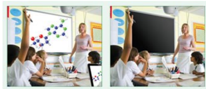
Eco AV Mute aus 100% Stromverbrauch

Behalten Sie während Ihrer Präsentation mit der ECO-AV-Mute-Funktion die Kontrolle. Richten Sie die Aufmerksamkeit Ihres Publikums durch Ausblenden weg von der Leinwand, wenn das Bild nicht benötigt wird. Dies reduziert den Stromverbrauch unmittelbar um 70%, und verlängert darüber hinaus die Lebensdauer Ihrer Lampe.