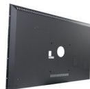
Zubehör für hintere Abdeckung