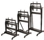
Elektrische Höhenverstellung PT-LIFTHL-4075